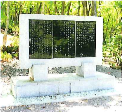
立松和平氏記念慰霊碑