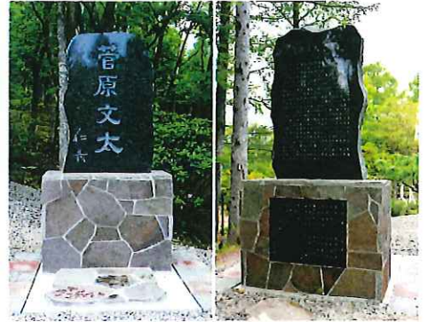
菅原文太氏記念慰霊碑