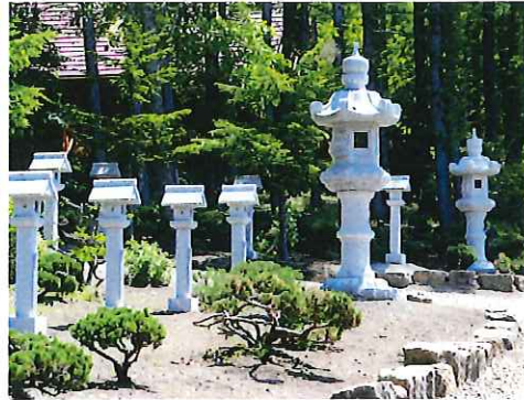
開村35周年・開堂20年記念灯籠建立